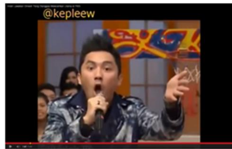
Omesh menirukan gaya Mamah Dedeh