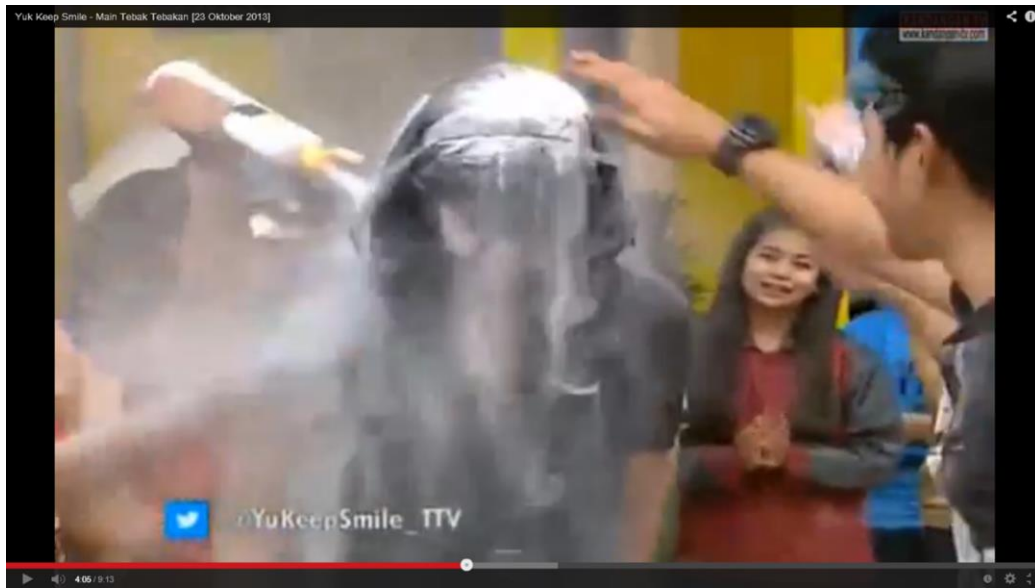
Gambar 4: Yuk Keep Smile