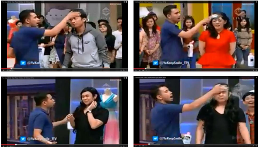
Gambar 3: Yuk Keep Smile